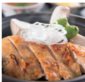
いわい鶏もも肉の陶板焼き