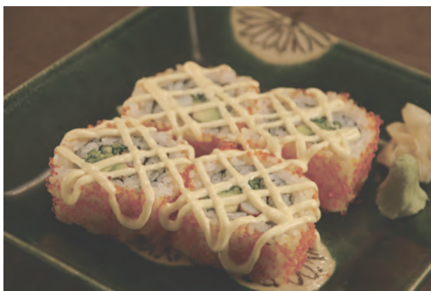
カルフォルニア巻き