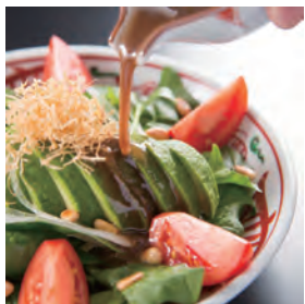
ポパイのサラダ 揚げ湯葉寄せ