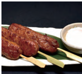
みつせ鶏つくね照り焼き