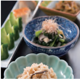
本日のおばんざい各種