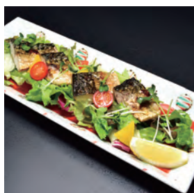
焼きサバと彩り野菜のサラダ