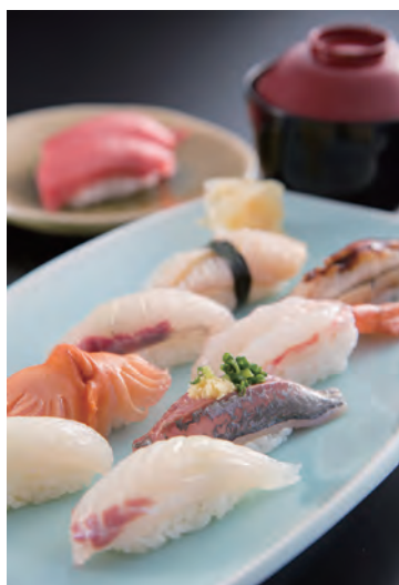
本日のおすすめ 寿司盛り合わせ