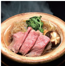
牛すき煮小鍋仕立