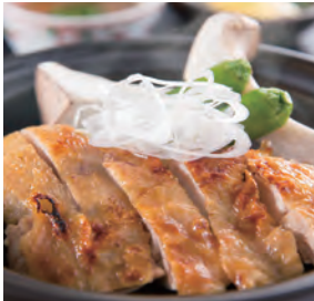
いわい鶏もも肉の陶板焼き