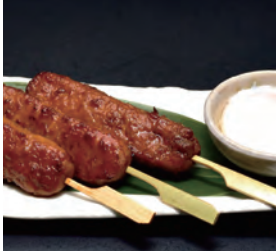
みつせ鶏つくね照り焼き