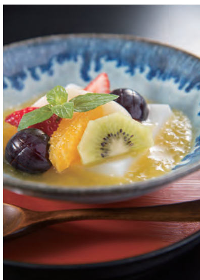
杏仁豆腐とフルーツ