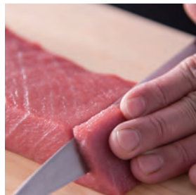
おまかせ刺身盛り合わせ