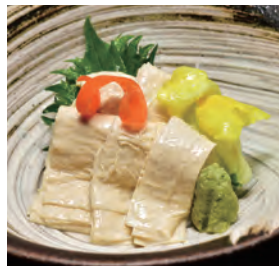
引き上げ湯葉の刺身