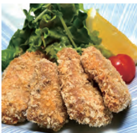
豚ヒレ肉のひと口カツ