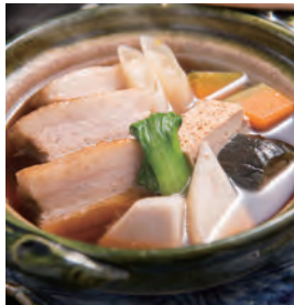
豚の角煮と野菜の小鍋