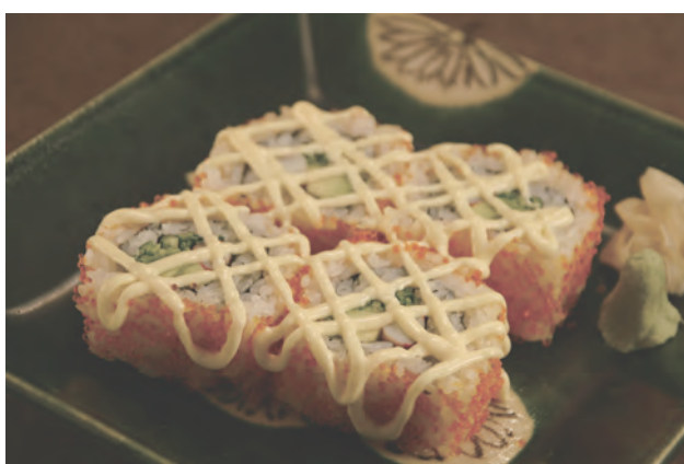
カルフォルニア巻き