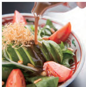
ポパイのサラダ 揚げ湯葉乗せ