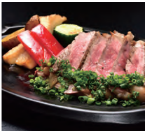
牛リブローズ陶板焼き